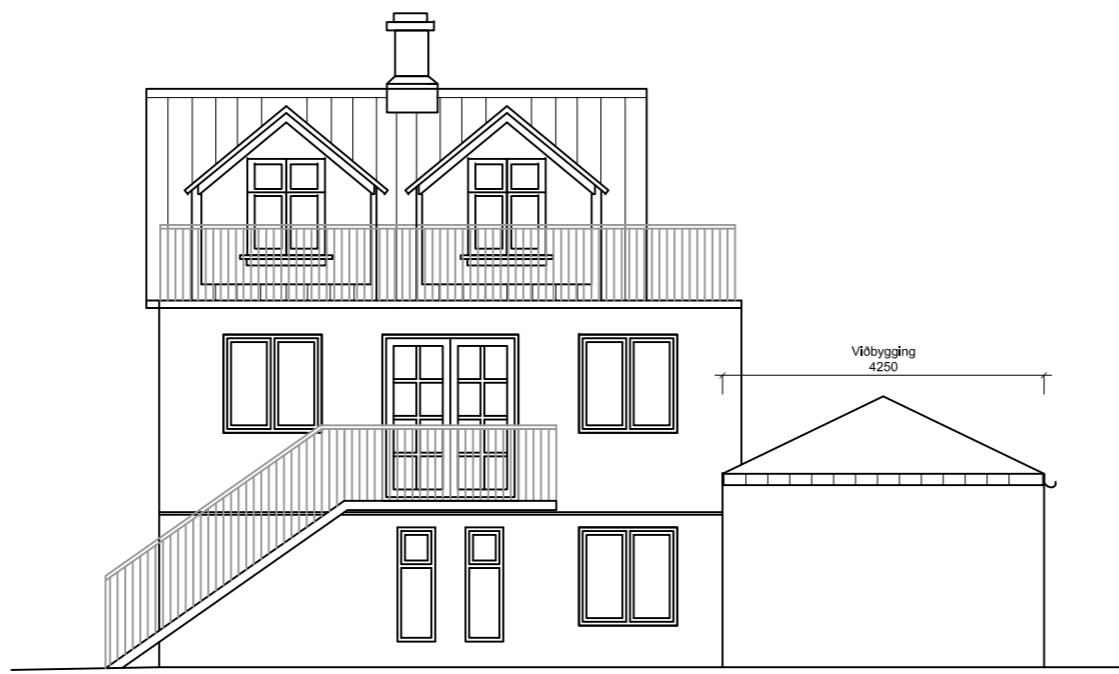
ÁSÝND NORÐUR 1:100