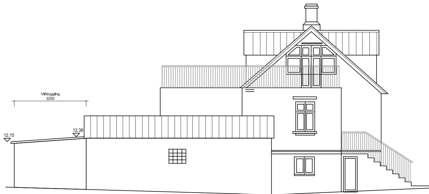
ÁSÝND VESTUR 1:100