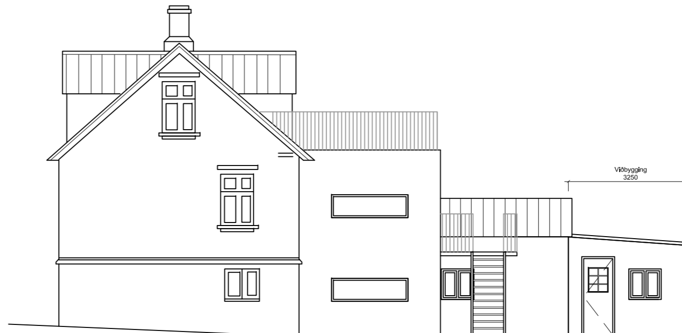
ÁSÝND AUSTUR 1:100

SKÝRINGAR: Upplýsingar þessar eru reyndarteikningar (áður gerðar breytingar) af húsi nr. 4 við Nönnustíg í Hafnarfirði, sem er timburhús byggt árið 1928. Á áður samþykktum teikningum er ekki gerð grein fyrir viðbyggingu norðan við bilgeymslu. Viðbygging er 13,8 m 2 að flatarmáli og 33,4 m 3 að rúmmáli. Viðbygging er timburhús á steiptum grunni. Sökkjar eru steiptir og er einangrað innan á sökkla með 75 mm plasteinangrun. Veggir eru timburgrind 45x125 mm og er einangrað í grind með steinull. Að innan eru veggir klæddir gipsi en að utan eru veggir klæddir bárujárni. Þak er timburþak. Sperrur eru 45 x 200 mm og er einangrað milli sperra með steinull með vindvörn. Loftað er milli sperra úti veggklæðningu. Klæðning á sperrur er gisklædd borðaklæðning sem er klædd pappu og bárustáli.